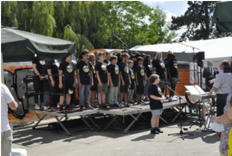
Auftritt des Chors „SingEmotion“

Beispielen führte sie aus, wie es in der SJA immer wieder gelingt, benachteiligte Kinder zu stärken, sie zu ermuntern, ihnen Lust auf Leben zu geben.